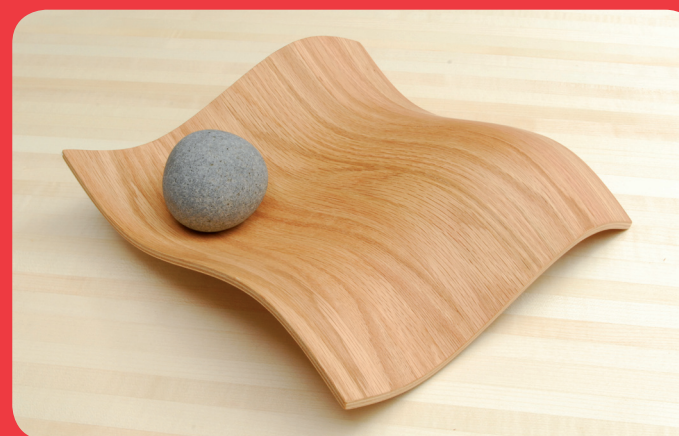
WOODON by REHOLZ

Die Verwendung von Vinterio führt zu erheblich festere Leimfugen. Es ist deshalb auch für das Postforming geeignet ohne zu brechen und dadurch den Fertigungsprozess zu stören.