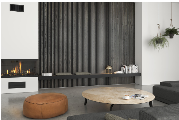
In Ergänzung zum Eiche Rustic Sortiment bietet die Roser AG die ganze Palette (vier Farbvarianten) als Furnier Express Akustik ab Lager an.

Eiche Rustic wird in vier unterschiedlichen Farbtypen angeboten, welche alle mittels natürlicher Färbung erreicht werden. Die Fixmasse in Eiche Rustic sind allesamt mit gebürsteter Oberfläche und schwarzem Mittelvlies verfügbar.