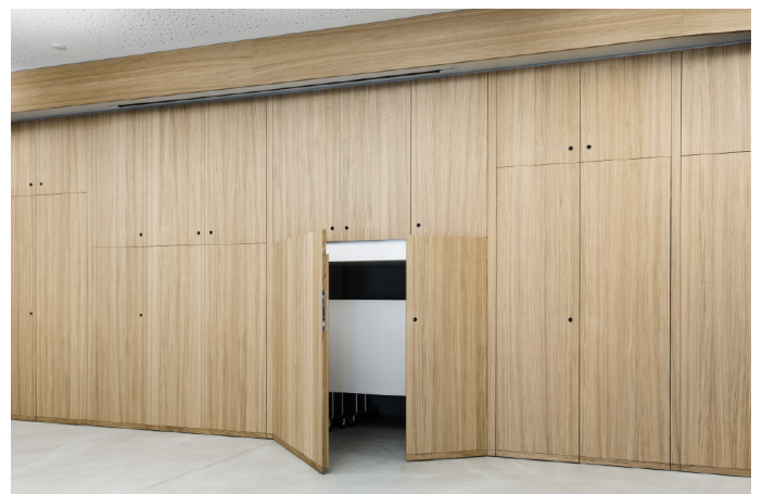
Die de'nice GmbH, Rheinfelden, hat sich bei der Fertigung einer multifunktionalen Schrankwand mit furnierter Front für Eiche Fixmassen der Roser AG entschieden.