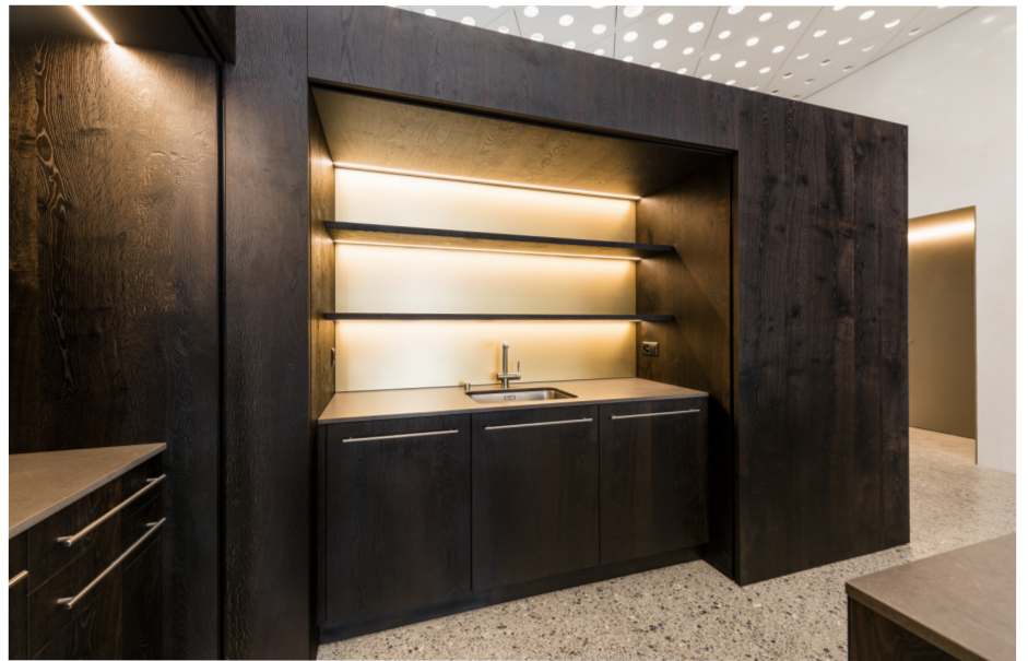
Attraktive Office-Küche der Tschudin AG, Basel in Eiche Rustic Mokka.

Denn der Furnier-Express schafft Sicherheit in jeder Hinsicht. Die Eiche-Natur-Fixmasse werden ausschliesslich aus Rift- und Halbbrift-furnieren in konstanter Qualität und Sortierung erzeugt. Das bedeutet konkret: jederzeit nachbestellbar, keine Lagerhaltungskosten und null Risiko eines Qualitätsverlustes. Die Kalkulation der Furnierarbeit wird so zur leicht beherrschbaren Nebensache. Der Verschnitt ist mit den Fixmassen einfach umsetzbar. Zudem gibt es keine unangenehmen