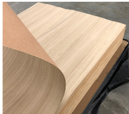
Die Furnier Fixmasse in der Ausführung Eiche Natur geschliffen.

bar. Eventuelle Risse und offene Äste werden hierdurch schwarz hinterlegt. Ab Lager gibt es die Rustic Fixmasse in den Farbvarianten Stone (grau), Antik (Braun), Mocca (schwarz) und Natur in den Abmessungen 2440 x 1220 mm. Passendes Kantenmaterial in allen Varianten ist ebenfalls ab Lager verfügbar.